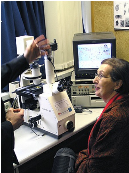
Heide Simonis am Mikroskop bei der BlueBiotech

Heide Simonis besichtigte am 31. Januar im Rahmen ihrer Wahlkampftour wieder zahlreiche Firmen und Organisationen. Als erstes frühstückte sie mit Senioren im AWO-Servicehaus in Elmshorn. Danach ging es weiter zu der Firma BlueBiotech in Büsum, die mit Algen Forschung und Entwicklung betreibt, unter anderem zur Herstellung von biologischen Nahrungsergänzungsmitteln.